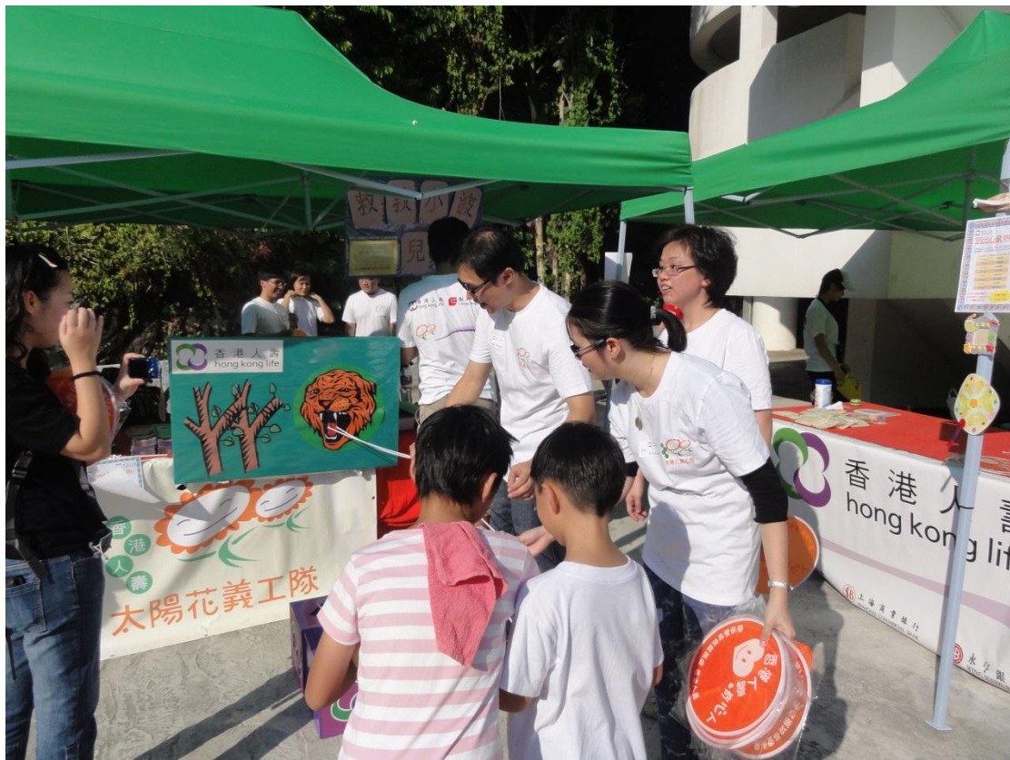
香港人壽设计的益智摊位游戏，吸引在场小朋友参与。