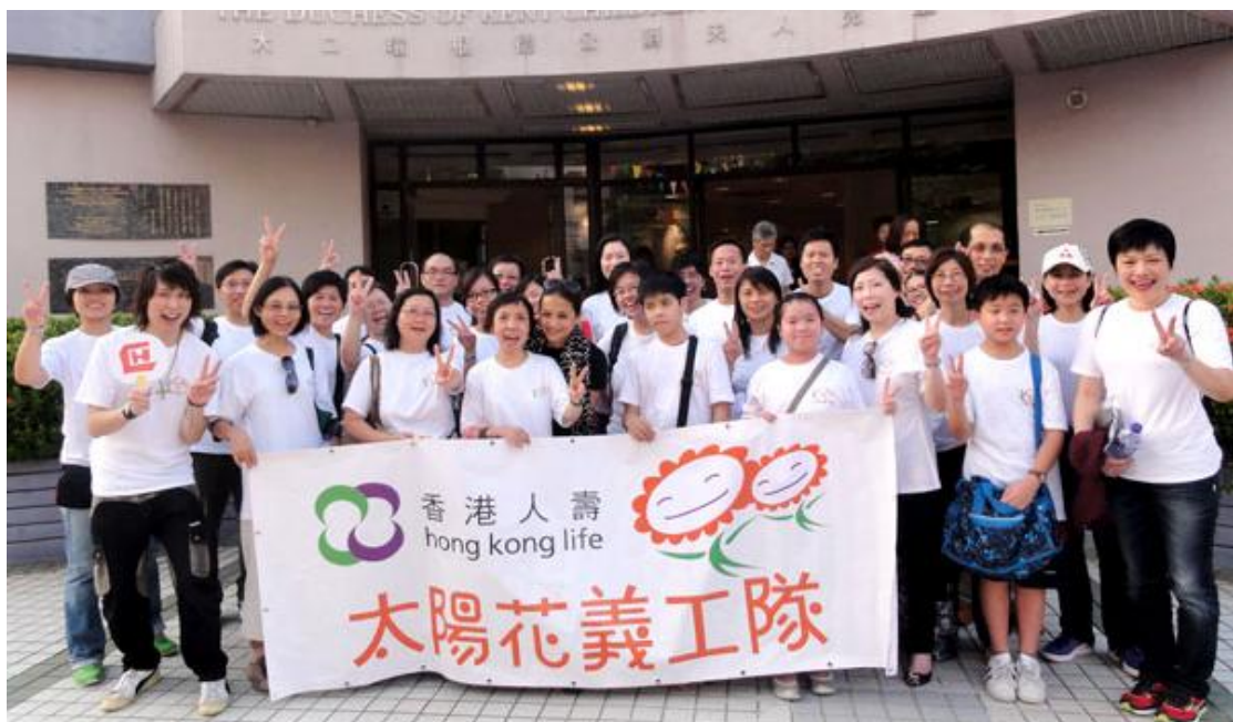
一眾企業義工于拍攝大合照后，怀着兴奋及依依不舍的心情离开。