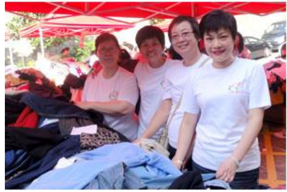
企业义工于不同摊位中进行义卖，众志成城为大会筹募善款。